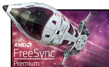
FreeSync™ Premium Technology

Технология панелей Fast IPS гарантирует не только высокое качество изображения, яркие сцены сражений, отображаемые с выдающейся точностью цветопередачи, но и выдающееся время отклика движущегося изображения (MPRT) 0,8мс.