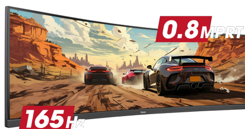
165Hz & 0.8ms MPRT

Ultrabrede 32:9 monitoren met een DQHD 5120x1440 resolutie, ook bekend als Dual QHD, garanderen messcherpe beelden die je games tot leven brengen. Deze monitoren stellen je in staat om je gamingopstelling te organiseren voor een ongeëvenaarde game-ervaring. Geen enkel detail zal aan je voorbijgaan!