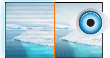
Flicker free + reductor de luz azul

La tecnología de panel VA ofrece mayor contraste, negros más oscuros y ángulos de visión mucho mejores que la tecnología estándar TN. La pantalla se verá bien sin importar el ángulo desde que la mires.