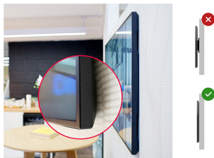
Zero-Gap Wall Mount

Designed to perform in continual, around the clock environments, the LH6570UHB can be installed and utilised in landscape and portrait orientation. The jaw dropping and best-in-class 35mm total depth (when used with the included proprietary brackets) will mean this display can be installed discreetly and elegantly in all areas.