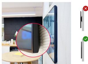
Zero-Gap Wall Mount

Designed to perform in continual, around the clock environments, the LH5070UHB can be installed and utilised in landscape and portrait orientation. The jaw dropping and best-in-class 30mm total depth (when used with the included proprietary brackets) will mean this display can be installed discreetly and elegantly in all areas.