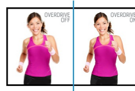
OverDrive ON / OFF

Deze techniek is niet afhankelijk van een extra touch-laag die vóór het LCD-panel wordt geplaatst. Daarmee is het ongevoelig voor slijtage of beschadiging. Het (bijna) aanraken van het het panel met een stylus of de vinger (met of zonder handschoen) volstaat. Deze ifrared touch-techniek garandeert optimaal beeld doordat door het ontbreken van een extra touch-plaat de beeldeigenschappen ongewijzigd blijven.