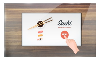
Тач через стекло

IPS дисплеи известны своими широкими углами обзора, естественными цветами и точной цветопередачей. Они особенно хорошо подходят для приложений по работе с цветом.