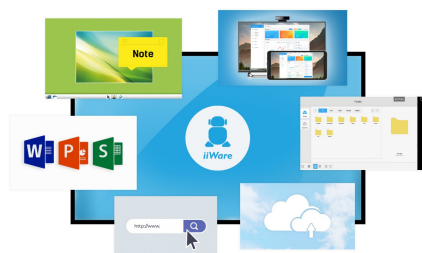
iiWare 8.0 (Android OS)

Delite, strimujte i uređujte sadržaj sa bilo kojeg uređaja direktno na ekranu i pretvarajte sastanke ili predavanja svog tima u laganu, brzu i neometanu interaktivnu sesiju sa uključenim WiFi modulom ( OWM001 ) i aplikacijom ScreenSharePro.