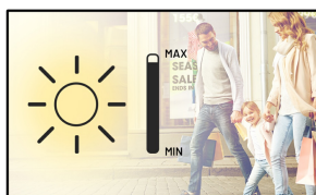
Čitelnost při působení slunečního světla

Obsahuje non-blackening panel LED IPS M + pro výjimečné a dlouhotrvající barvy a výkon obrazu. Model LH7510USHB dokáže pracovat ve vodorovném i svislém režimu, tedy je možno ho obrátit rovněž na výšku. Pracuje v režimu 24/7 a proto nabízí efektivní, dlouhodobé a energeticky účinné řešení, které pomáhá upoutat pozornost publika i v těch nejsvětlejších místech.