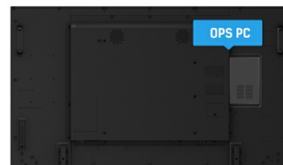
OPS PC SLOT

IPS-schermen staan vooral bekend om hun brede kijkhoeken en natuurlijke, zeer nauwkeurige kleuren. Ze zijn bijzonder geschikt voor kleurkritische toepassingen.