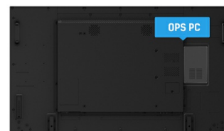
OPS PC SLOT

Les écrans IPS sont surtout connus pour leurs larges angles de vision et leurs couleurs naturelles très précises. Ils sont particulièrement adaptés aux applications à couleur critique.