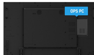
OPS PC SLOT

IPS displays are best known for wide viewing angles and natural, highly accurate colours. They are especially suited for colour-critical applications.