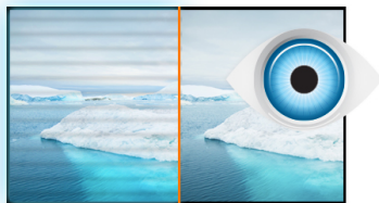
Flicker free + Blue light

The ProLite B2283HS-B3 is an excellent 22" Full HD LED-backlit monitor with 1920 x 1080p resolution. It features 1ms response time and 80 000 000 : 1 Advanced Contrast Ratio, assuring clear and vibrant picture quality and high contrast. Triple Input support ensures compatibility with the latest installed graphics cards and embedded Notebook outputs. The ergonomic stand offers 13 cm height adjustment with pivot and swivel, making this screen suitable for a wide range of applications and environments where workplace flexibility and ergonomics are key factors. The monitor is TCO Certified. A perfect solution for education, local government, business and finance markets.