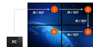
Support en Daisy Chain

La technologie AMVA3 offre un contraste plus élevé, des noirs plus sombres et les angles de vision bien meilleurs que la technologie traditionnelle TN. L'image aura l'air bien quel que soit l'angle sous lequel vous la regardez.