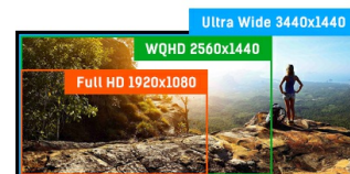
ULTRA WIDE - UWQHD

Les écrans IPS sont surtout connus pour leurs larges angles de vision et leurs couleurs naturelles très précises. Ils sont particulièrement adaptés aux applications à couleur critique.