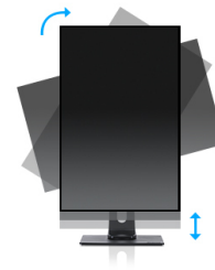
HAS + Pivot

La technologie VA offre un contraste plus élevé, des noirs plus sombres et les angles de vision bien meilleurs que la technologie traditionnelle TN. L'image aura l'air bien quel que soit l'angle sous lequel vous la regardez.