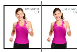
OverDrive ON / OFF

Les écrans IPS sont surtout connus pour leurs larges angles de vision et leurs couleurs naturelles très précises. Ils sont particulièrement adaptés aux applications à couleur critique.