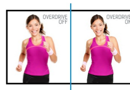
OverDrive ON / OFF

I display IPS sono noti soprattutto per gli ampi angoli di visione e i colori naturali e precisi. Sono particolarmente adatti per applicazioni critiche dal punto di vista del colore.