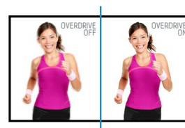
OverDrive ON / OFF

Les écrans IPS sont surtout connus pour leurs larges angles de vision et leurs couleurs naturelles très précises. Ils sont particulièrement adaptés aux applications à couleur critique.