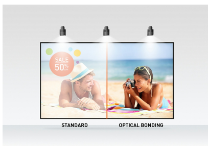
Optical bonded PCAP

De flexibele voet kan in verschillende hoeken worden geplaatst, waardoor een comfortabele en ergonomische gebruikerservaring ontstaat. Het geïntegreerde kabelbeheersysteem verbergt alle kabels en elektrische draden, waardoor een nette en kabelvrije werkruimte ontstaat. De Anti-Glare coating voorkomt hinderlijke beeldreflectie van de omgeving, waardoor de kleurweergave, het contrast en de scherpte niet worden beïnvloed. Een perfecte keuze voor een breed scala aan toepassingen, zoals interactieve toepassingen en Digital-Signage zoals instore retail, POS en interactieve presentaties.