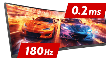
180Hz & 0.2ms MPRT

The Fast IPS panel technology guarantees not only high-fidelity, vivid battleground scenes displayed with outstanding colour accuracy but provides also an outstanding 0.2ms Moving Picture Response Time (MPRT).