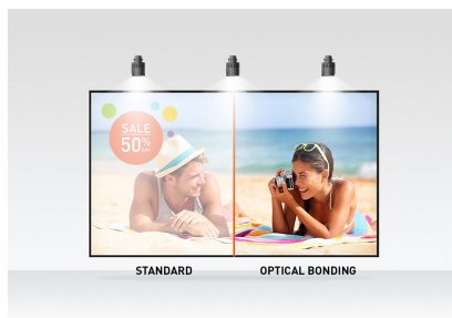
PCAP sa optičkim vezama

Takođe dostupan u beloj : ProLite T2752MSC-W1