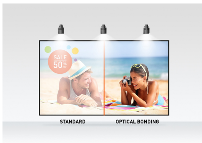
Optical bonded PCAP

Disponible también in white : ProLite T2752MSC-W1