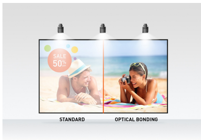
Optical bonded PCAP

Le ProLite T2755MSC avec la résolution Full HD (1920x1080) et la dalle IPS offre des couleurs exceptionnelles et de larges angles de vision. La technologie tactile PCAP (Optical Bonded Projective Capacitive) à 10 points garantit une réponse tactile transparente et précise, ainsi qu'une réflexion lumineuse réduite. Un revêtement nanométrique spécial assure un toucher plus doux et moins de résistance lors du balayage. Il rend l'écran moins statique et moins sensible à la saleté, à la poussière et aux empreintes digitales. Un choix parfait pour un large éventail d'applications.