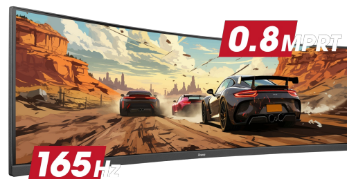
165Hz & 0.8ms MPRT

Ultra-wide 32:9 monitors boasting DQHD 5120 x 1440 resolution, also recognized as Dual QHD, guarantee razor-sharp images that bring your games to life. These monitors empower you to organize your gaming setup for an unparalleled gaming experience. You won't miss a single detail!