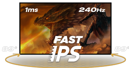
240Hz & 1ms MPRT

Die Fast IPS Panel Technologie garantiert dir eine hervorragende Bildqualität, die Black Tuner Technologie lässt dich selbst kleinste Details in schwach ausgeleuchteten Spielumgebungen erkennen, sodass nichts deiner Aufmerksamkeit entgeht. Dank des höhenverstellbaren Standfusses kannst Du die Bildschirmposition ganz einfach an deine Vorlieben anpassen, um Dir einen guten Komfort während deiner Gaming-Session zu gewährleisten.