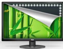
Rétro-éclairage à LED

Disponible aussi en blanc : ProLite B1980D-W5