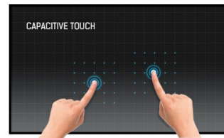
Dokunmatik teknolojisi - Kapasitif (PCAP)

Bu teknoloji, ekranı kaplayan cama entegre edilmiş mikro ince tellerden oluşan bir sensör ızgarası kullanır. İnsan parmağı camın üzerine yerleştirildiğinde sensör ızgarasının elektriksel özellikleri değişir, dokunma algılanır. Cam kaplama sayesinde bu teknoloji son derece dayanıklıdır ve cam çizilse bile dokunma işlevi etkilenmez. Mükemmel görüntü performansı sunar ve insan parmağıyla (ayrıca lateks eldivenli) ve stylus kalemle çalışır.