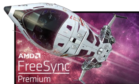
FreeSync™ Premium Technologie

Mit 165Hz Bildwiederholrate und 0.5ms Reaktionszeit ist die Kraft mit Dir! Treffe Entscheidungen in Sekundenbruchteilen, die Bilder werden immer gestochen scharf angezeigt.